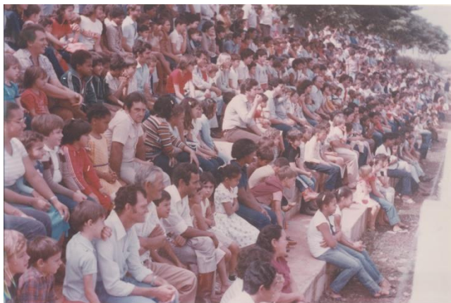
Publico presente no Centro de Lazer Municipal.

Informativo "Agora na Câmara" é uma publicação mensal das Atividades do Poder Legislativo de Morro Agudo(SP) elaborado pelos estagiários e servidores desta Casa de Leis.