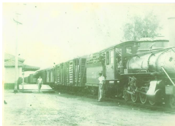
Estação Ferroviária desativada no final da década de 60