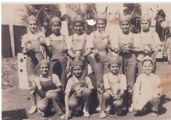
Garotas representando a festa da Páscoa.

A memória do nosso povo conservada em cerca de mais de 1500 fotografias. Visite o nosso acervo histórico, de Segunda a Sexta, das 13 às 17 horas.