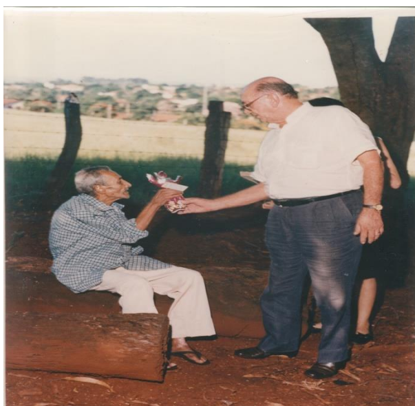
Prefeito Alfredo Benedetti, no Asilo São Vicente de Paula, por ocasião das comemorações da Páscoa.

Informativo “Agora na Câmara” é uma publicação mensal das Atividades do Poder Legislativo de Morro Agudo(SP) elaborado pelos estagiários e servidores desta Casa de Leis.