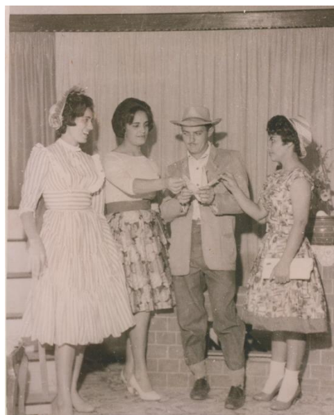
Festa Junina no Clube Recreativo Morroagudense.