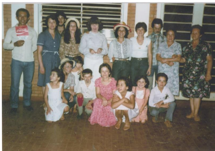
Festa Junina da catequese em 1.981

O informativo "Agora na Câmara" é uma publicação mensal das Atividades do Poder Legislativo de Morro Agudo (SP) elaborado pelos estagiários e servidores desta Casa de Leis.